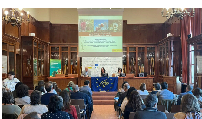
Segundo taller sobre medidas compensatorias

Continúa el ciclo de talleres sobre financiación innovadora para la conservación que conecta empresas y entidades de custodia del territorio