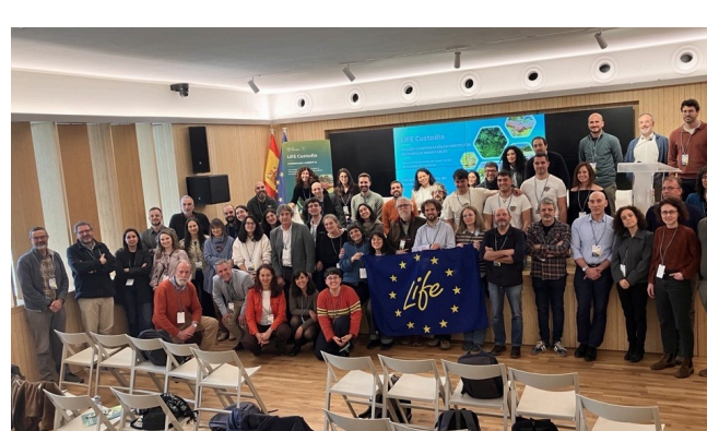
Tercer taller sobre custodia agraria y conservación de la biodiversidad